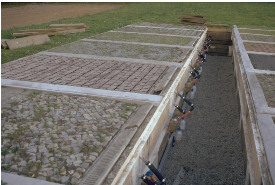
Abbildung 1. Teilversiegelte Lysimeteranlage in Berlin-Dahlem (SCHMIDT 2008, www.entsiegelung.de )

Das Ziel der Diplomarbeit war zeitliches ereignisabhängiges Abflussverhalten auf unterschiedlichen teilversiegelten Flächen zu untersuchen. Die Hypothese war dass der größere Fugenanteil die größere Abflussverzögerung verursacht. Als Ergebnis wurde der Zusammenhang der Abflussverzögerung mit Fugenanteil und Intensität des Anfangsniederschlags ermittelt. Zur Langzeitbeobachtung (minütlich Jun.2006 – Dez.2008) der Wasserhaushaltskomponenten wurde eine Lysimeteranlage in Berlin Dahlem genutzt (Abb. 1). Sie besteht aus 13 unterschiedlichen Teilversiegelungsarten und lieferte Versickerungs- und Abflussdaten basierend auf Kippwaagetechnik.