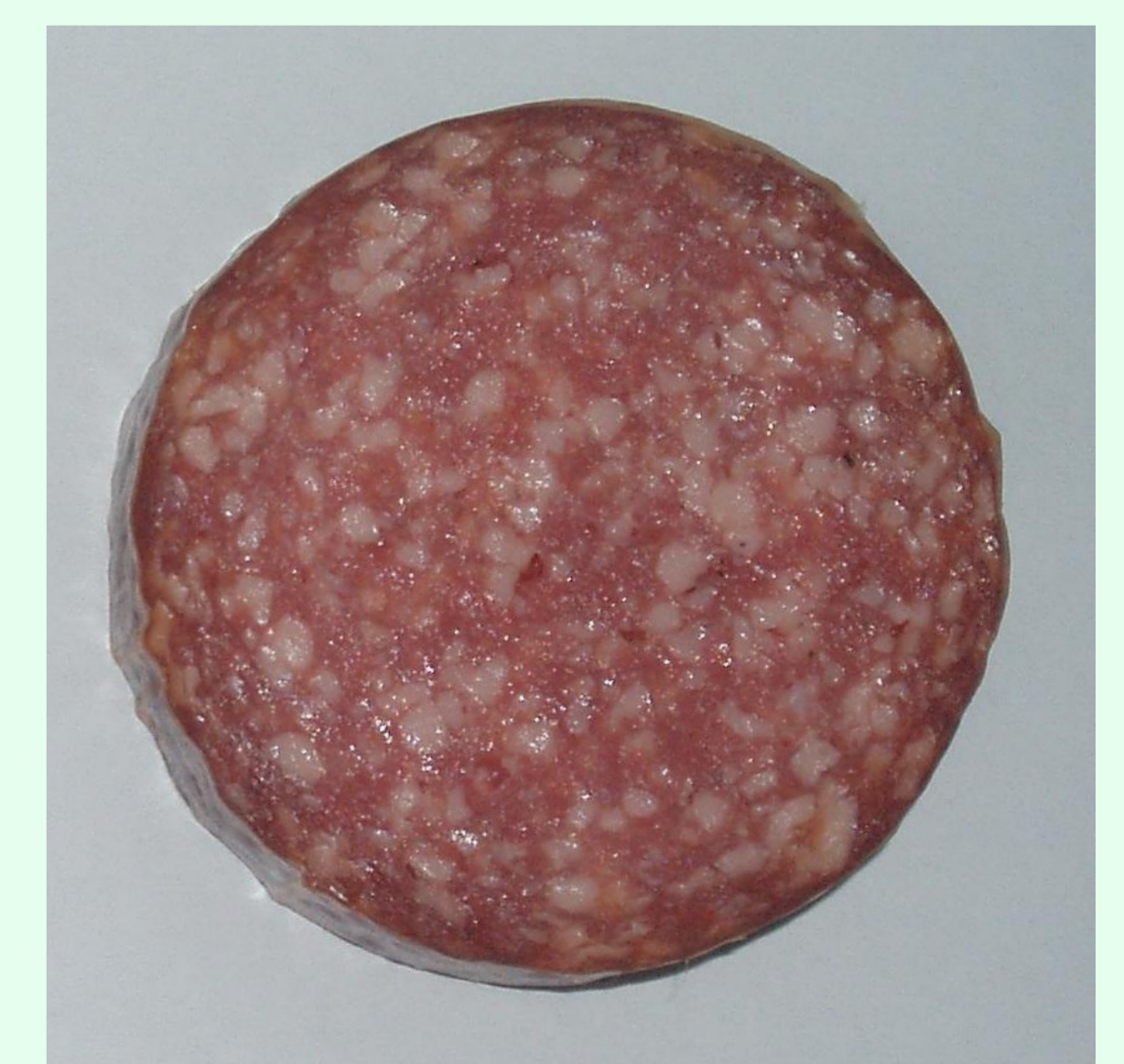
5- 10 % Fett