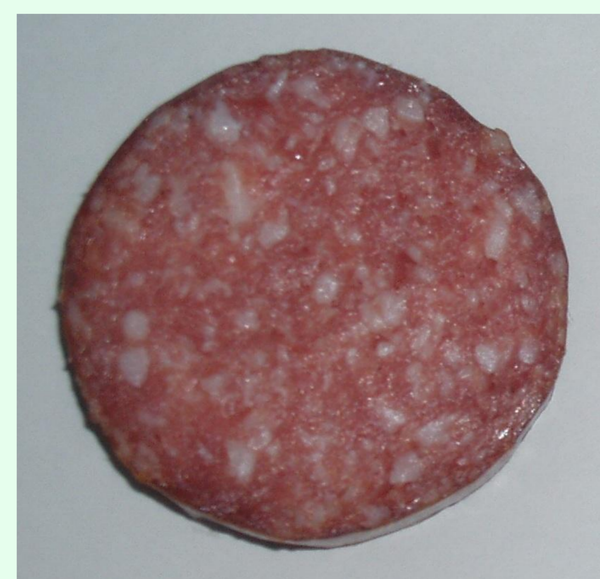
etwa 35 % Fett

Schnittbilder von konventioneller Salami (mit Speck) und fettreduzierter Salami (mit Fettersatzstoff)